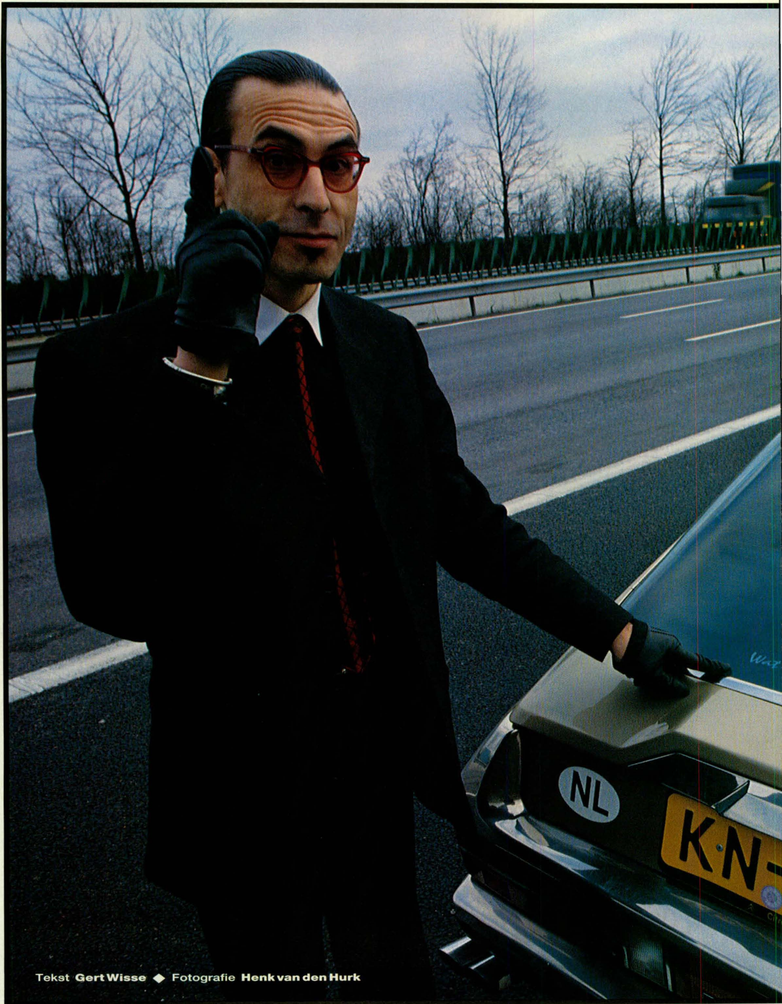
Tekst GertWisse