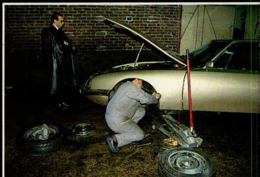
En daar staan we dan in de garage van Roye...