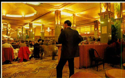
Nachtburgemeester Deelder in restaurant La Coupole.