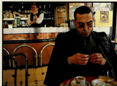
Een calvados heeft een positieve uitwerking op Deelders humeur.

Proeftijden, inname van het rijbewijs, hij heeft het allemaal meegemaakt. Justitie nam