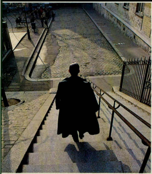
Treffende gelijkens met Graaf Dracula.

voor een deel uit ergernis. Maar dat geeft niet." Zittend achter een gin- tonic in de jazz- club en luisterend naar de weemoedige klanken van de Amerikaanse saxofonist Steve Grossman, had Deelder later die avond Goethe geciteerd om de SM te typeren: „Himmelhoch jauchzend, Zum Tode betrübt", dat is het!", had hij geroepen en een wijds gebaar makend refereerde hij vervolgens aan de schoonheid van de koets en de totaal vernielde linkervoorband.