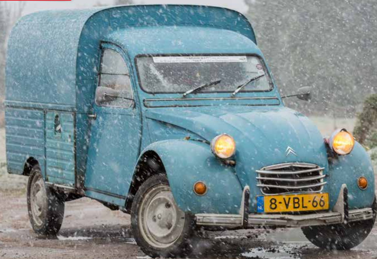
CITROËN 2CV 400